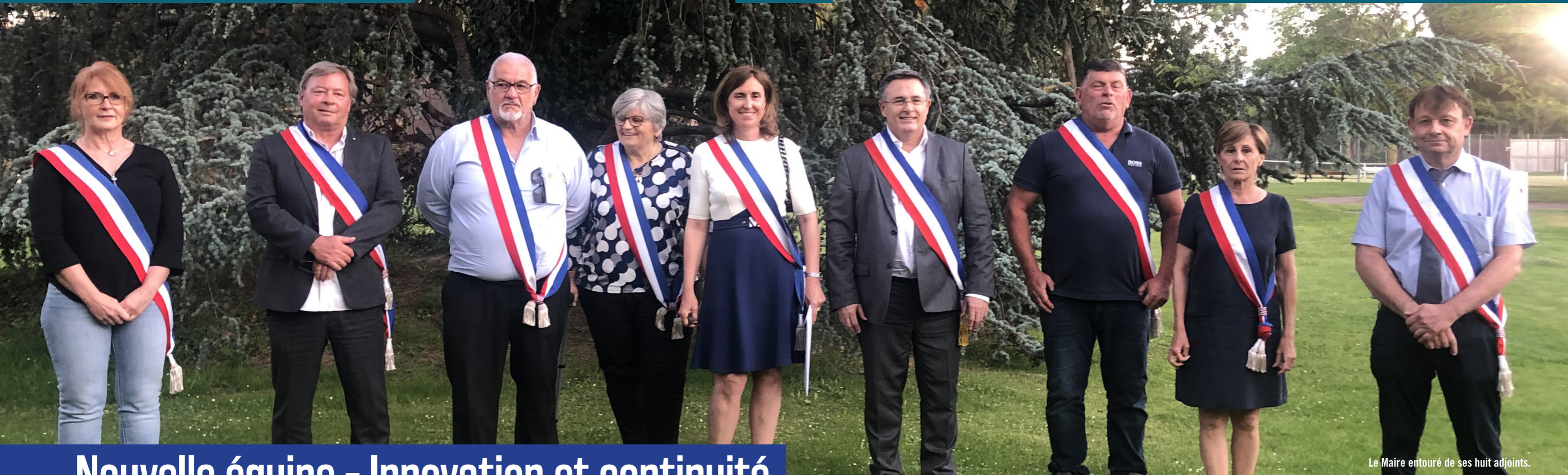
Le Maire entouré de ses huit adjoints.